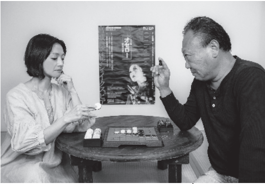
美加理(デズデモーナ役)と阿部一徳(オセロー役)対局の行方やいかに…?!

「美しきヴェネツィア人の妻デズデモーナ(白石)を持つムーア人の将軍オセロー(黒石)が緑の平原(緑の盤面)で勇敢に戦い、敵味方がめまぐるしく寝返っていく波乱万丈のストーリーに、緑の盤面上で黒白の石がひっくり返りながら形勢が次々変わっていくゲーム性をなぞらえた」と言われています。