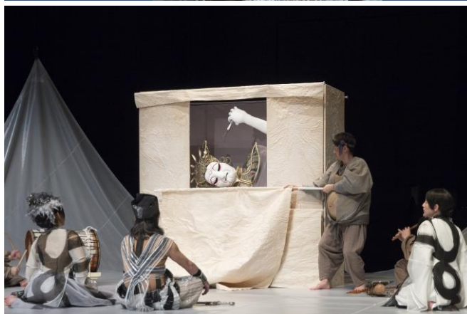
『ハムレット』(2015年)