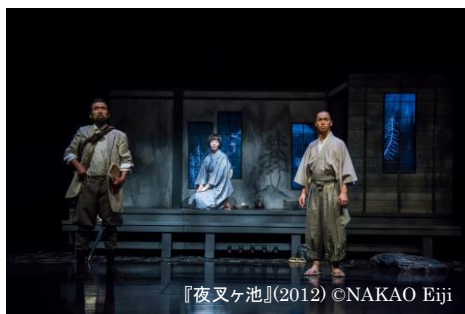
『夜叉ヶ池』(2012) ©NAKAO Eiji

大正初めの山深い村里を舞台に、美しい幻想世界を描いた泉鏡花の傑作戯曲。失踪した東大生、その友人が山奥の村で見たものとは…？美しく艶やかな衣裳と、俳優の生演奏による心を揺さぶる音楽。伝説、自然、恋物語が交差する興奮の舞台が、7年ぶりに待望の再演。