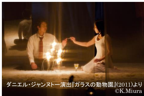
ダニエル・ジャンストー 演出『ガラスの動物園』(2011)より

現代フランスを代表する演出家の一人で、SPAC とはこれまで『ブラスティッド』(2009年)、『ガラスの動物園』(11年)、『盲点たち』(15年)で深い信頼関係を築いてきたダニエル・ジャンストー。彼が厳選したフランスの俳優と、SPACの俳優・スタッフが、全く新しいチャーホフの劇世界を描き出す。