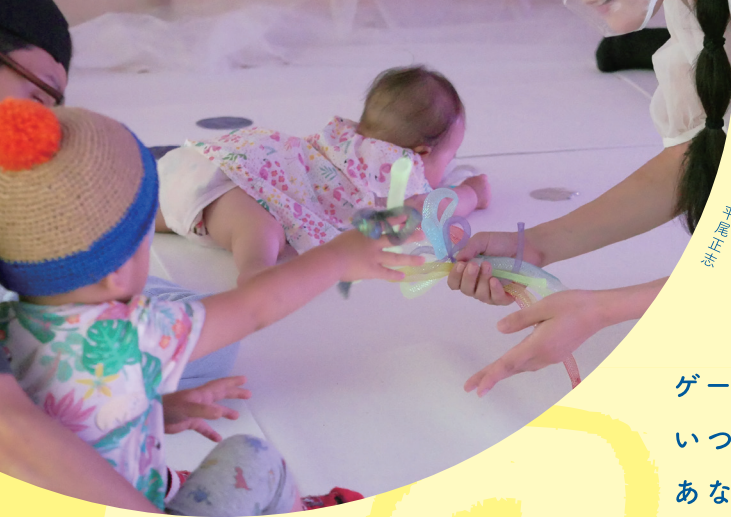
イメージ写真撮影：平尾千穂

ゲートをくぐると、そこは、すべてがさかさまな「鏡の国」。 いつもと少しちがうながめと、チグハグな冒険がつむぎだす、 あなたのとくべつなものがたり。