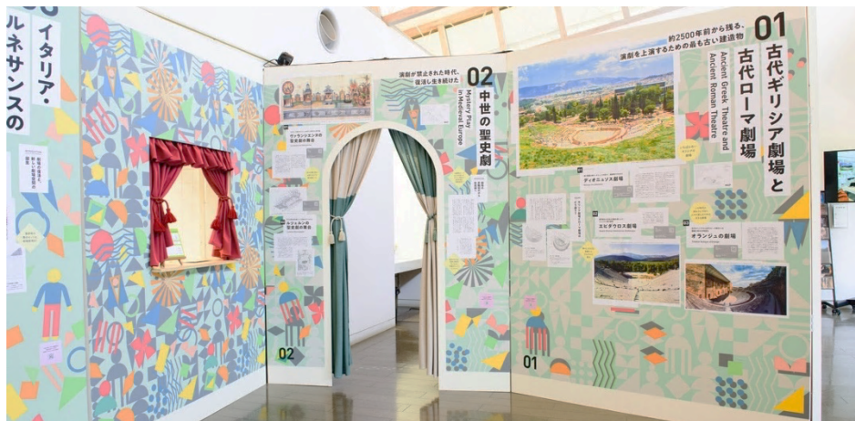
「MM てあとろん」の内観。展示パネルの下絵もすべて手作業で描かれています♪