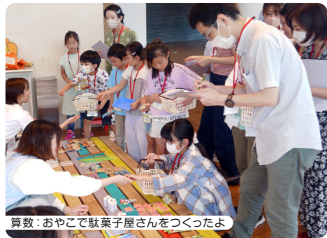
算数: おやこで駄菓子屋さんをつくったよ

「すばっくおやこ小学校in静岡」これまでの開催の様子 「おやこ小学校」ランドデザイン: YORIKO (株式会社ニューモア)