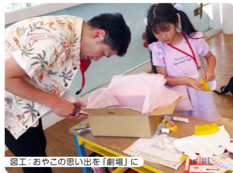
図工: おやこの思い出を「劇場」に