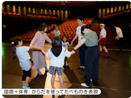
国語+体育: からだを使ってたべものを表現