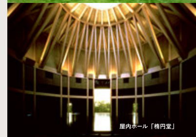
屋内ホール「楢円堂」