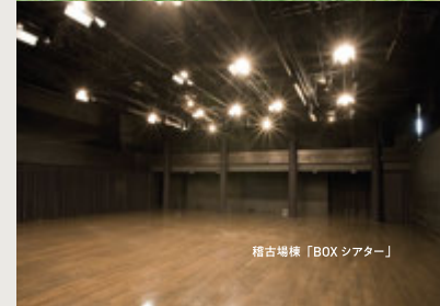
稽古場棟「BOXシアター」