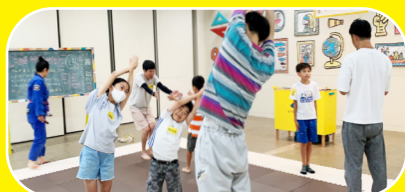
▲体育+国語：ミラーゲームでお互いの動きをまねたよ