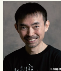
芸術総監督・宮城聡

静岡県舞台芸術センター（Shizuoka Performing Arts Center : SPAC）は、東静岡のグランシップにある静岡芸術劇場と日本平にある舞台芸術公園内の専用の劇場や稽古場を拠点として、俳優、舞台技術・制作スタッフが活動を行う静岡県立の劇団です。多彩なラインナップからなる舞台芸術作品の創造・上演とともに、世界中から作品が集まる「ふじのくに⇄せいかい演劇祭」の開催、中学生高校生を劇場に招待する中高生鑑賞事業「SPACeSHIP げきとも!」、人材育成事業、海外の演劇祭での公演、など様々な活動に取り組んでいます。また、劇場を飛び出して、地域の身近な場所での公演やワークショップなども行っております。